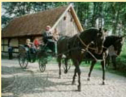
Gemütliche Kutschfahrten im Naturpark

In Kirchseelte bietet sich Gelegenheit zu einem Bummel durch den idyllisch gelegenen Ort und auf den Wanderwegen in der Umgebung.