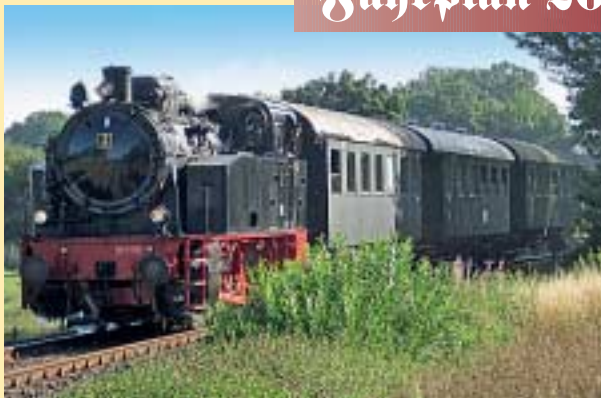
Museumseisenbahn auf der Strecke Harpstedt – Delmenhorst-Süd